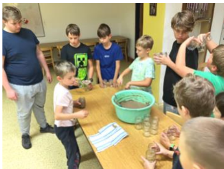
kluci ze skupinky Žraloci pod vedením odborníka vyrobili pro letošní jarmark misijní paštiku.